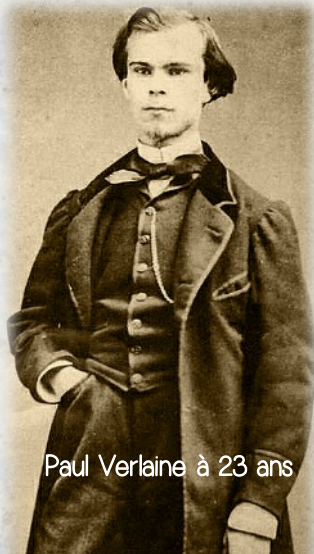
Paul Verlaine à 23 ans